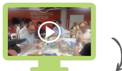
Les creativ'Labs de l'Université Catholique de Lille

Découvrez en vidéo quelques uns des tiers lieux de l'Université Catholique de Lille en tapant l'intitulé exact du nom de la vidéo directement sur Youtube :